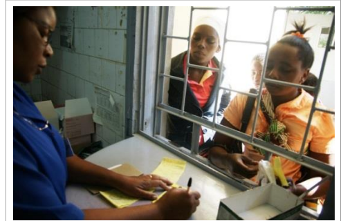
Une pharmacienne à Chokwe en Mozambique dispense du Coartem et explique à une femme comment administrer le médicament à son enfant souffrant du paludisme.

Pour faire face à cette situation déplorable, SIAPS utilise des approches et outils de renforcement des systèmes visant à améliorer l'accès aux produits et services de santé. Nos experts techniques coopèrent avec des représentants locaux et nationaux des pays concernés afin de développer et de soutenir la mise en place de politiques pharmaceutiques bien fondées, de systèmes de gestion efficace, de systèmes de réglementation plus robustes, de financement équitable ainsi que de pratiques garantissant la qualité et la sécurité des produits dans les pays en développement d'Afrique, d'Asie, d'Europe de l'Est, d'Amérique latine, des Caraïbes et du Moyen-Orient.